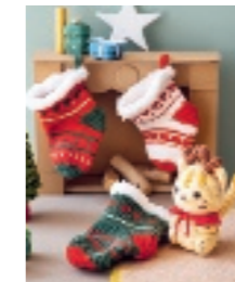
KATJE CHI MET KERSTSOKKEN 83