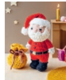
KERSTMAN MET ZAK 67