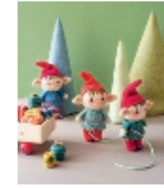
DE ELFENJONGENS 53