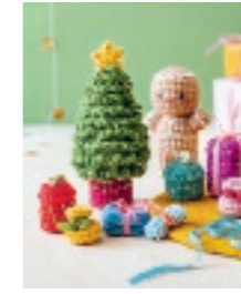
ALEX HET PEPERKOEK- MANNETJE 37