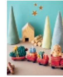
EEN ECHTE KERSTREIN 45