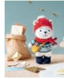
LEON DE IJSBEER 29