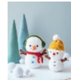
CARO EN THOMAS DE VROLIJKE SNEEUWPOPPEN 91