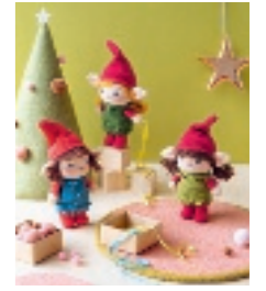
DE ELFENMEISJES 59