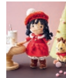
ANNA HET KLEINE MEISJE 75